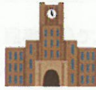
学校種 国公立/私立